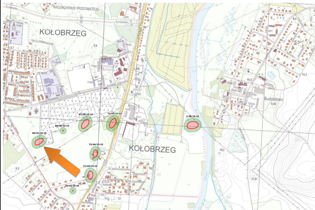
Obszar stanowiska przedstawiony w szerszym kontekście

Janocha H., karta ewidencji stanowiska archeologicznego, arkusz AZP 15-15/41/69, 1987.